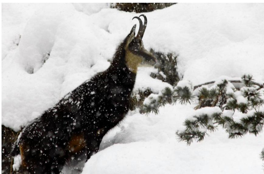
aufgenommen beim Fallbachwasserfall in Absam / Gnadenwald am 31.12.2011